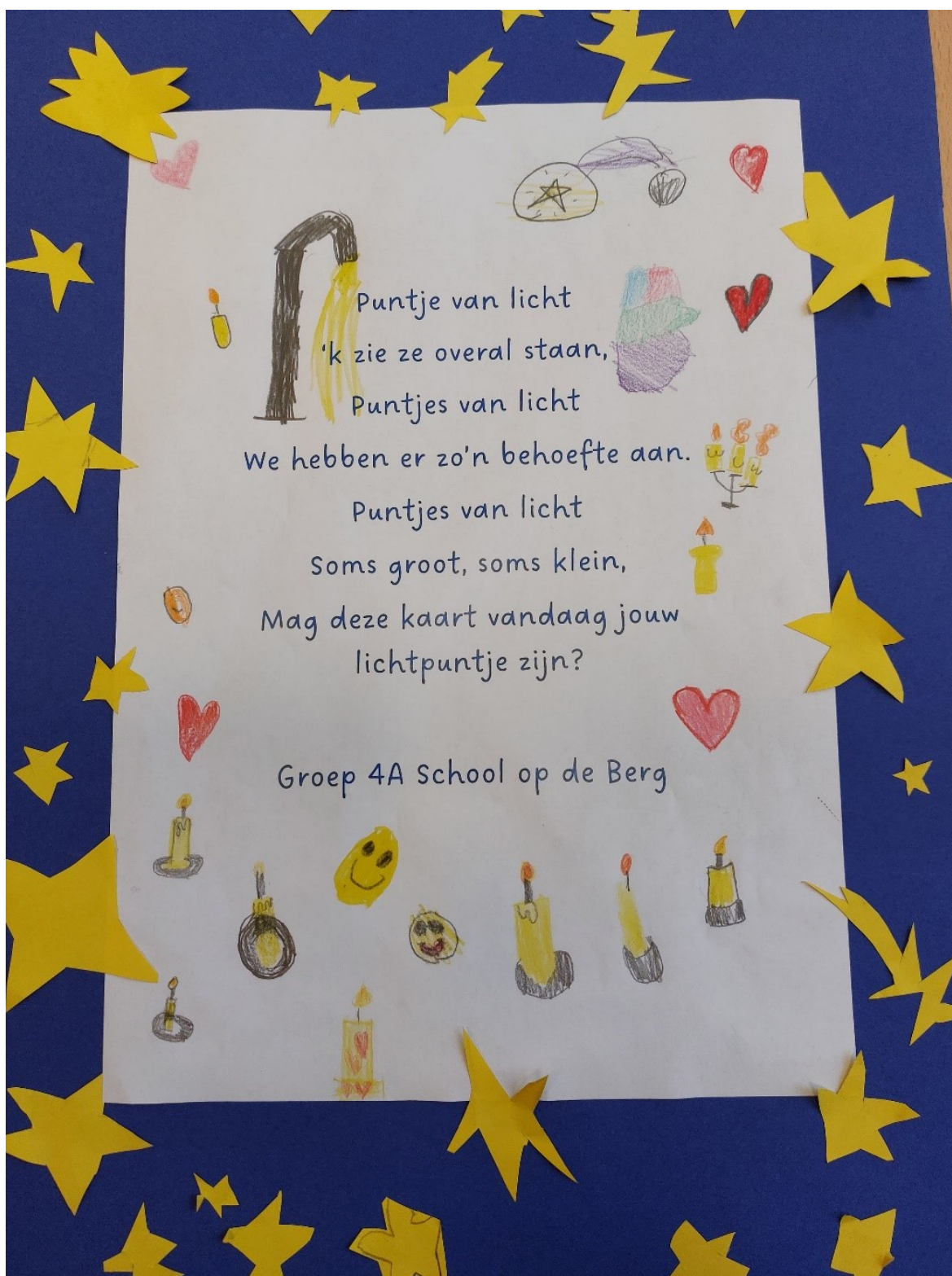
Een reactie bleef niet uit. Als blijk van waardering kregen de bewoners van Eikenstaete in het nieuwe jaar dit bedankje, gemaakt door de leerlingen, uitgereikt.